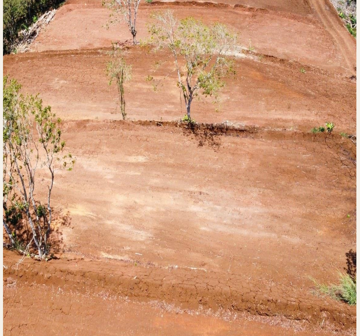
La Guaría de San Ramón · Zona central del proyecto