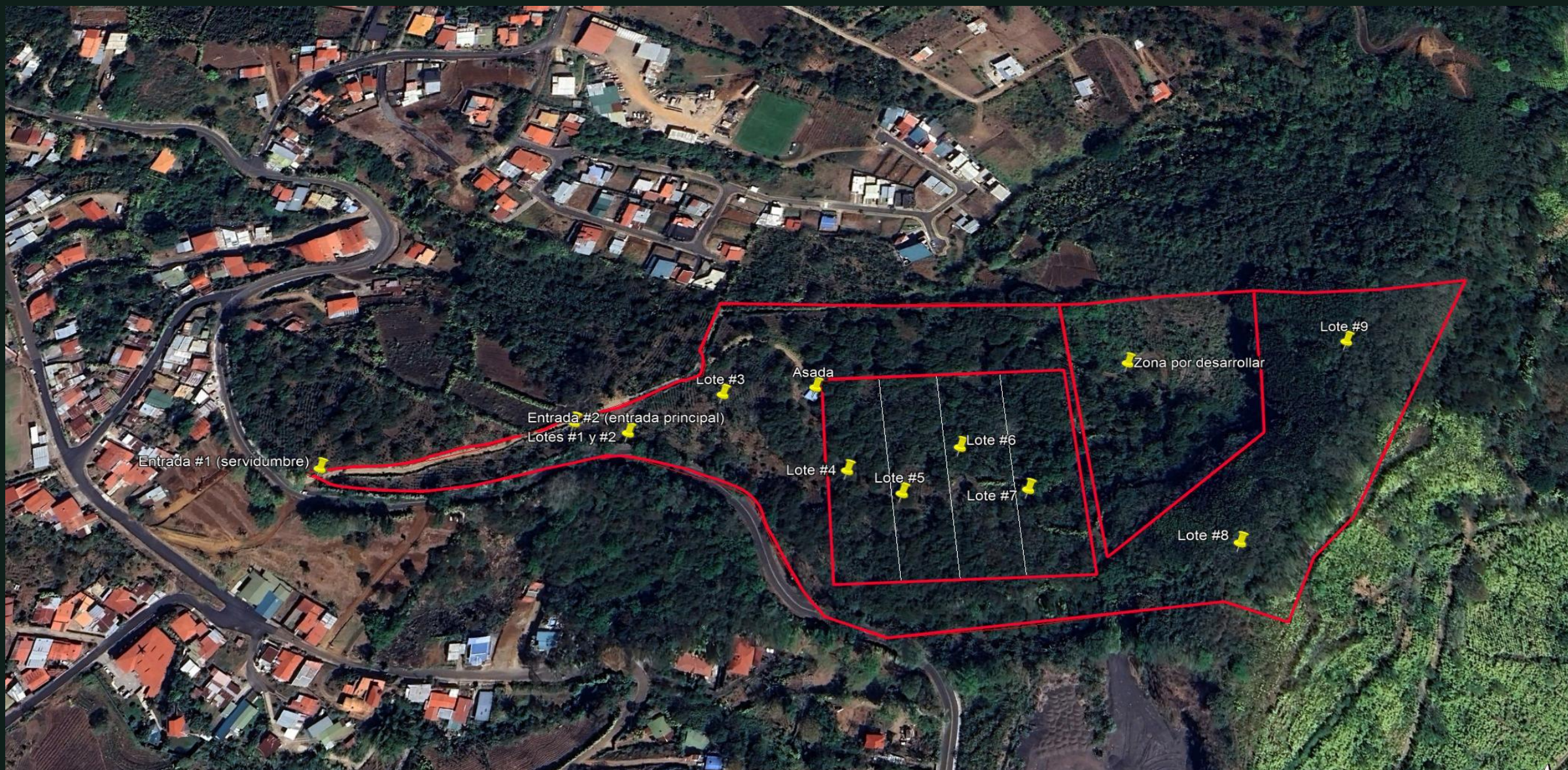
Propiedad delimitada en rojo · Lotes numerados del #1 al #9 · 2 entradas + zona por desarrollar