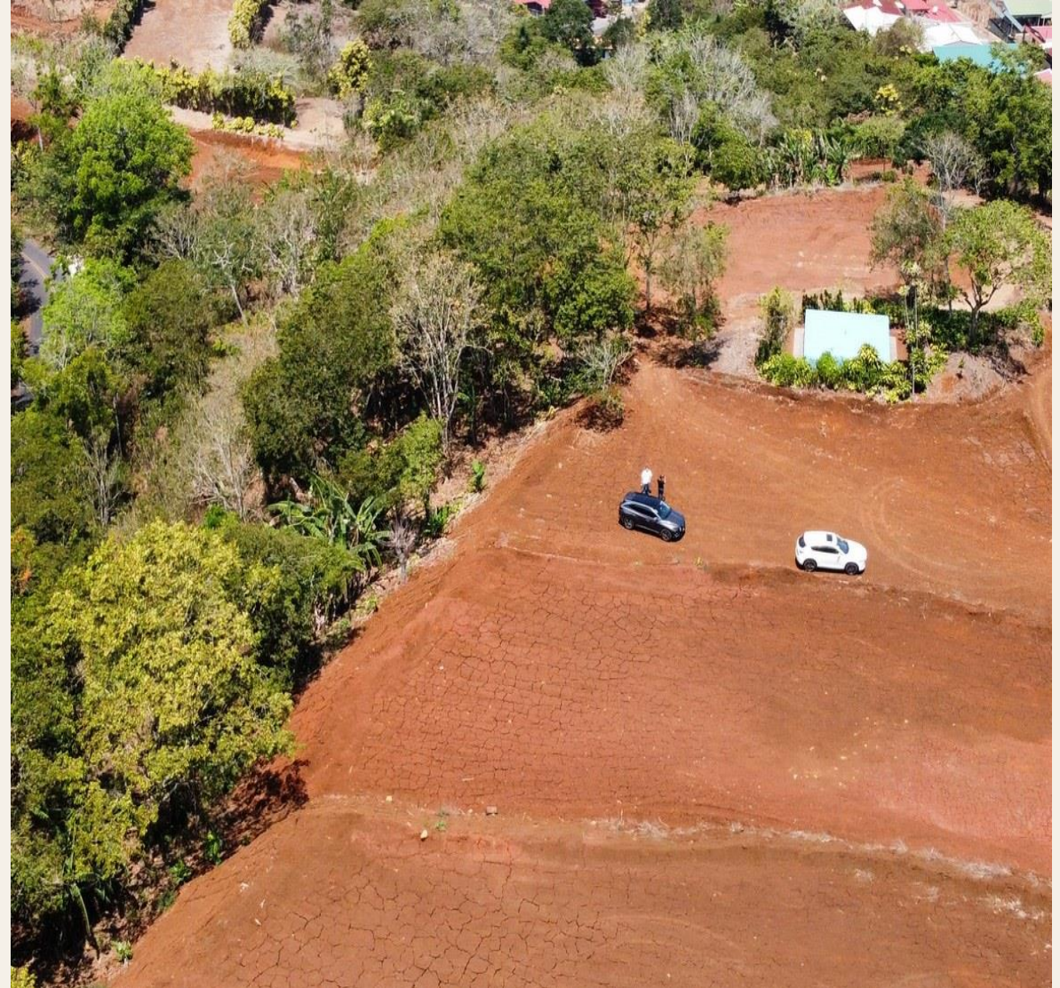
La Guaría de San Ramón · Zona boscosa · Mayor privacidad