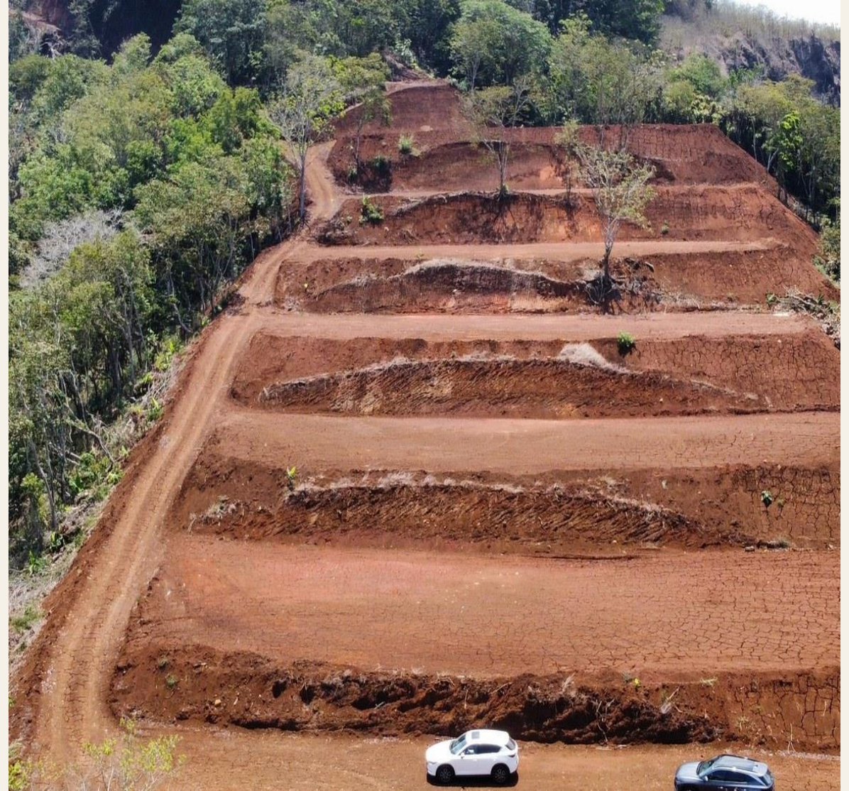
La Guaría de San Ramón · Vista a montañas y naturaleza circundante