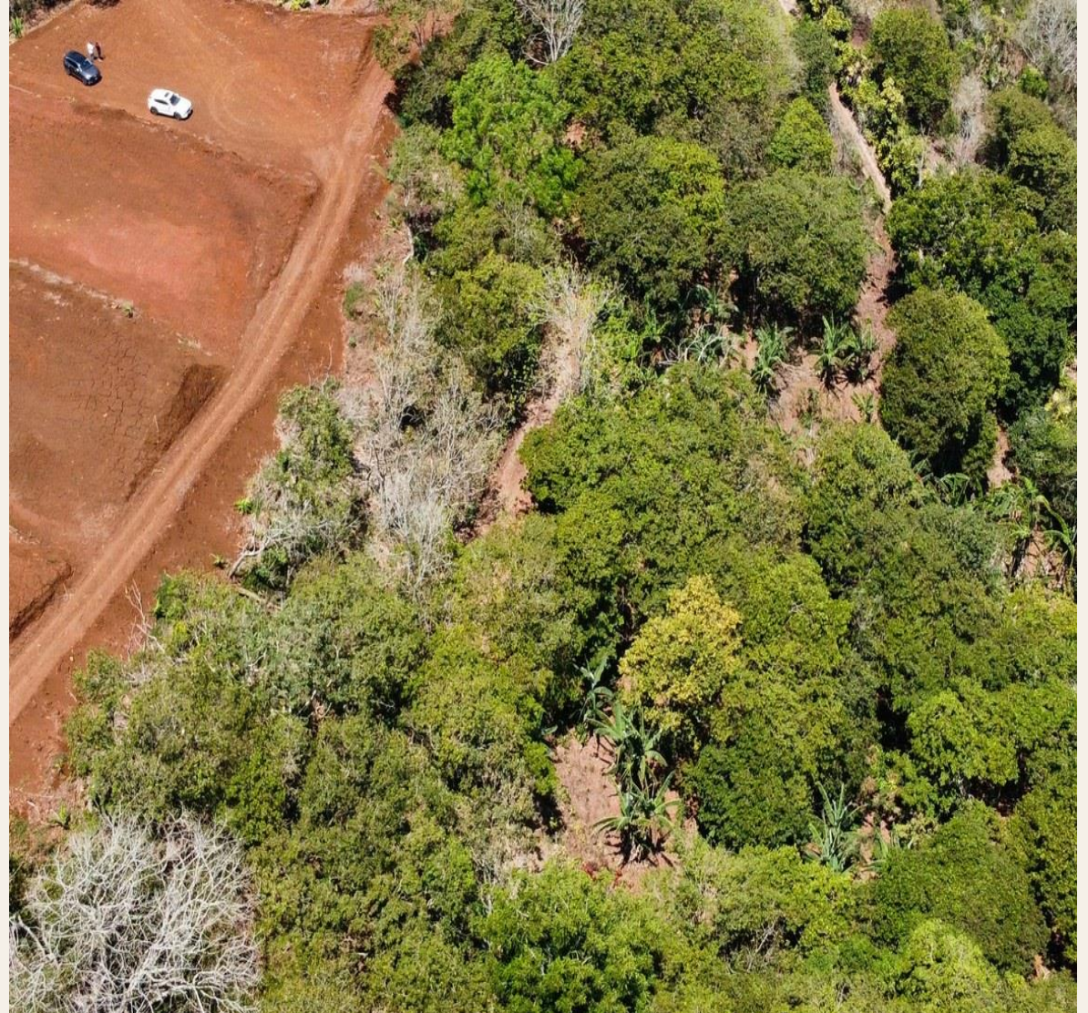
La Guaría de San Ramón · Excelente accesibilidad interna