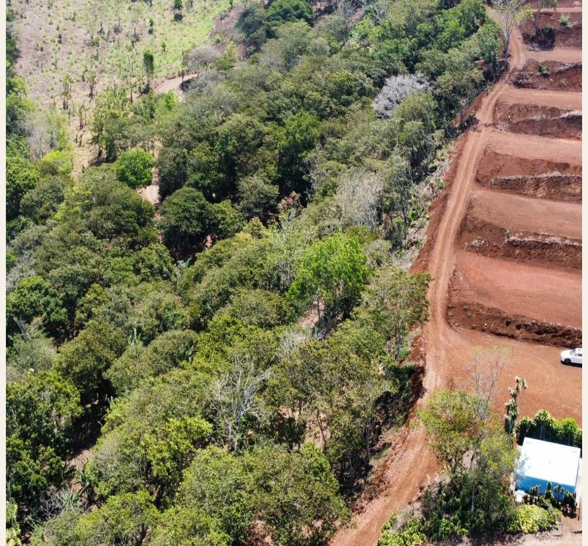
La Guaría de San Ramón · Terreno con movimiento de tierra completado