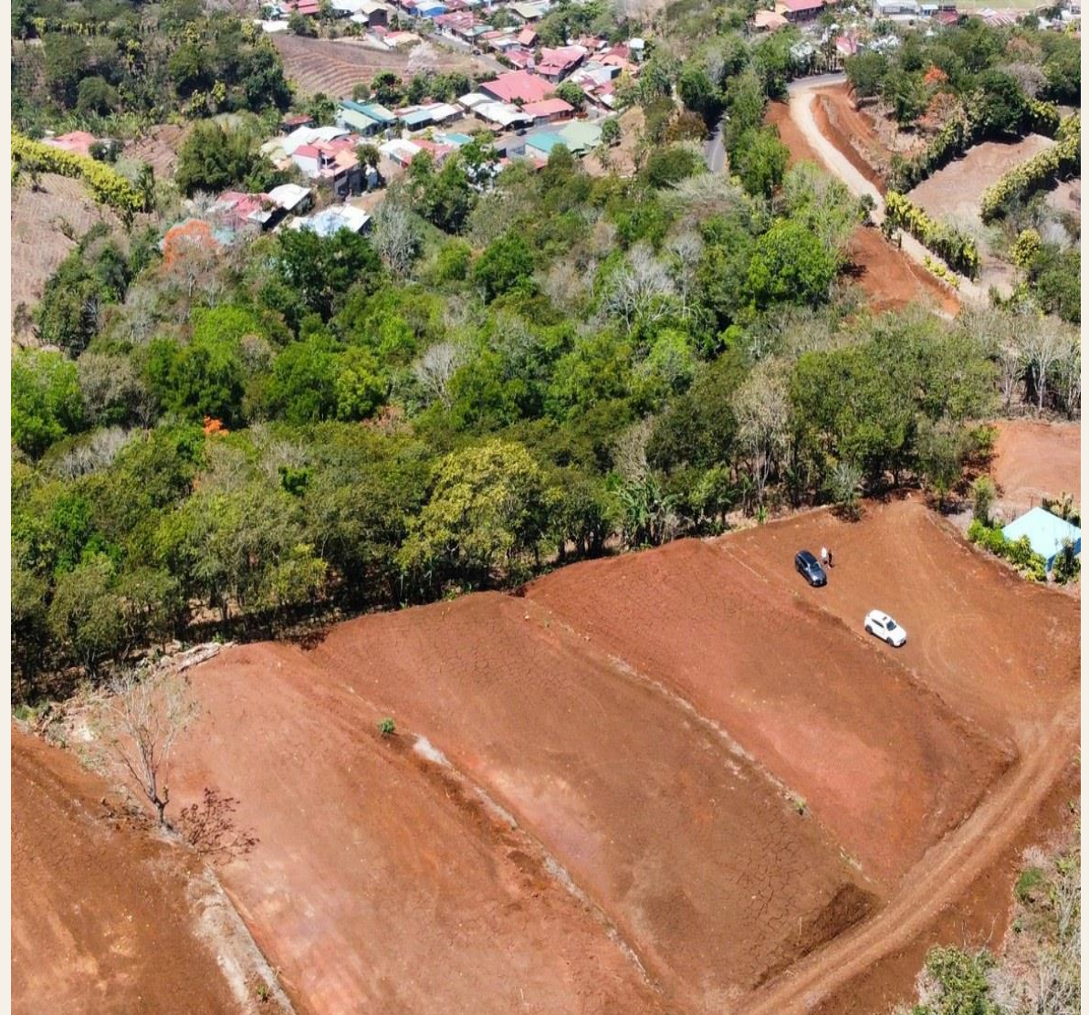
La Guaría de San Ramón · Amplias vistas panorámicas hacia San Ramón y Palmares